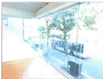
☆2階路面側全面ガラス張り